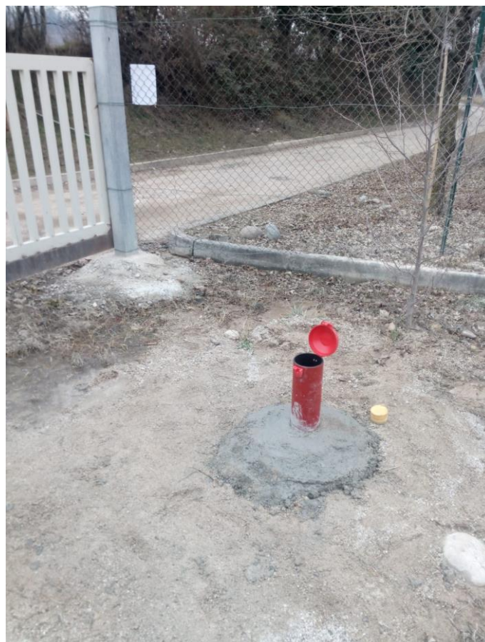
FOTO DEL PUNTO DI CAMPIONAMENTO