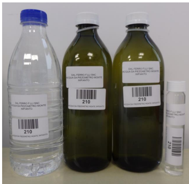
FOTO DEL CAMPIONE